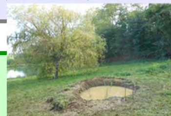
mare crée sur la commune des Haies en 2015

Vous pouvez participer aux animations et formations proposées dans le programme : https://www.parc-naturel-pilat.fr/nos-actions/milieux-naturels/abc/